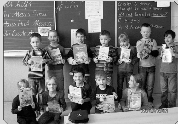
Die Teilnehmer der 1. Klasse beim Vorausscheid