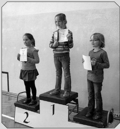
Die Sieger der Klasse 1