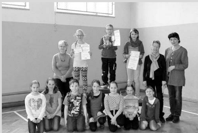
Unsere Jury und alle Teilnehmer am Endausscheid des Vorlesewettbewerbes