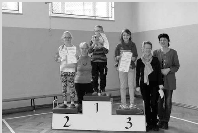
Die besten Vorleser konnten sich über wertvolle Buchprämien freuen.