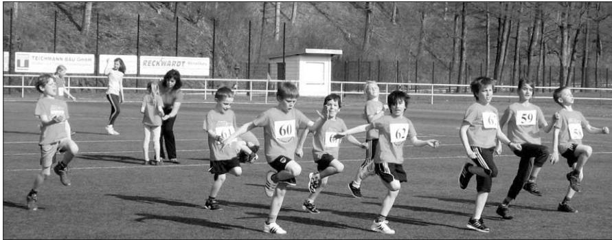
Warmlaufen mit Gymnastik ist ganz wichtig!