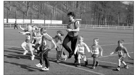
Die Vorschulgruppe bei der Erwärmung

25. April gaben sich ganz toll Mühe und veranlassten den Stadionsprecher immer wieder, unsere Starter nach ihrem Namen und ihrem Alter zu fragen.