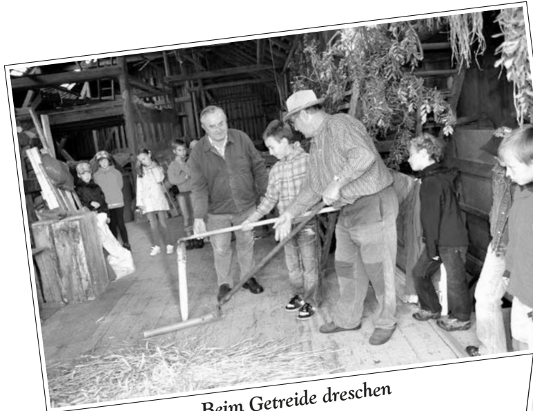
Beim Getreide dreschen