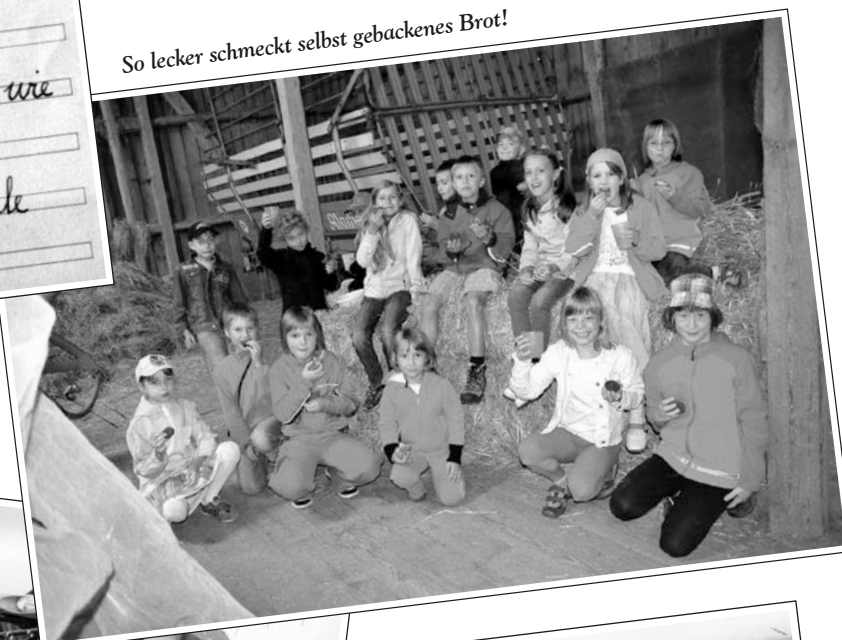
So lecker schmeckt selbst gebackenes Brot!