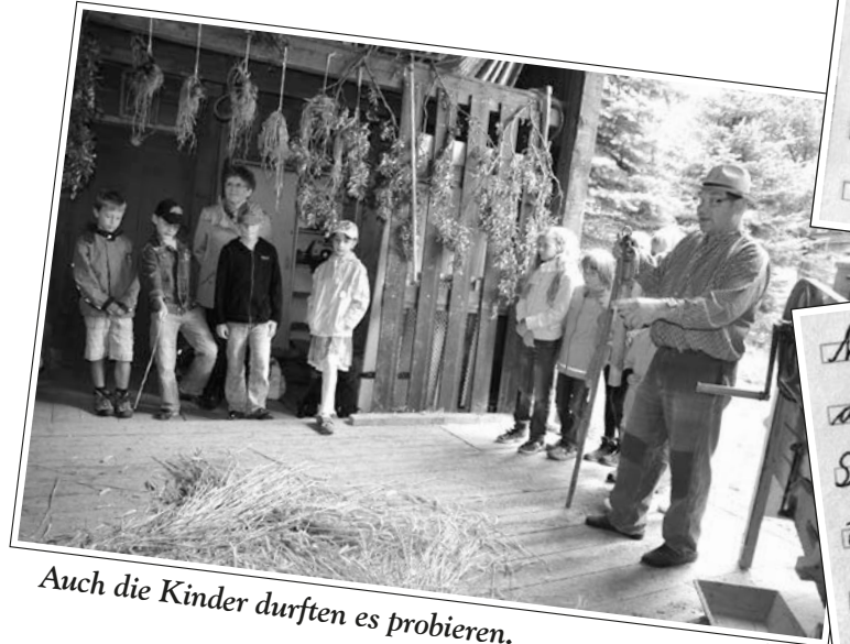
Auch die Kinder durften es probieren.