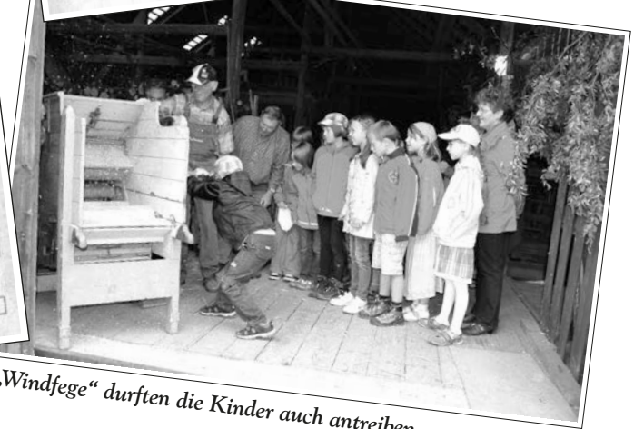
Die „Windlege“ durften die Kinder auch antreiben.

Mit der Windlege wurden anschließend die Körner und die Spreu getrennt. Wir hatten fleißig beim Drehen. Man konnte die Körner entweder mit einer Kaffeemühle oder mit einer Getreidemühle zu Mehl gemahlen werden.