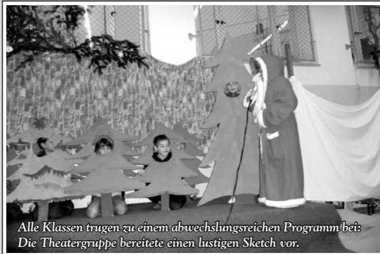
Alle Klassen trugen zu einem abwechslungsreichen Programm bei: Die Theatergruppe bereitete einen lustigen Sketch vor.