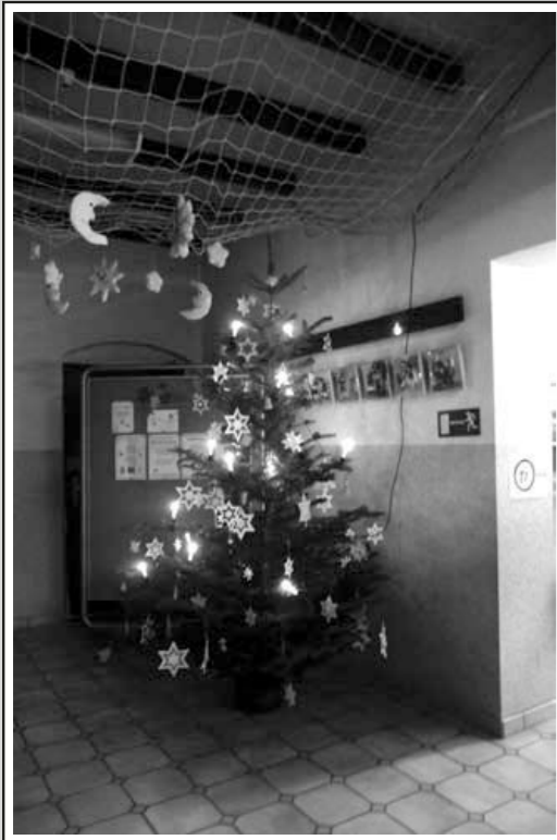
Ein festlich geschmückter Weihnachtsbaum erwartete die Gäste am Eingang.