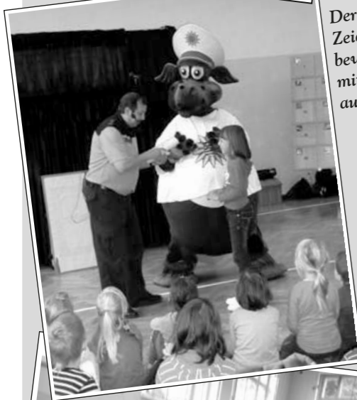
Der Mal- und Zeichnungswettbewerb wurde mit Poldi ausgewertet.